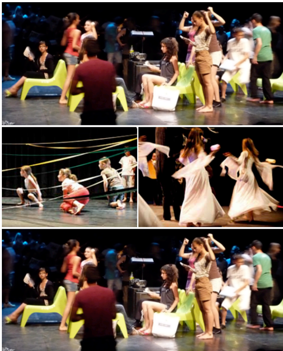
Spectacle « L'étrange Noël de Mr Jack », FCA 2010

Le festival choral, tel qu'il s'organise dans l'académie d'Aix - Marseille, offre aux choristes, sur l'ensemble du territoire une équité des pratiques, privilégie les rencontres et favorise une mixité des populations. La diversité des projets est le reflet d'une dynamique des équipes enseignantes convaincues de l'importance de leurs actions qui, enrichies des liens tissés avec des partenaires artistiques professionnels, place les élèves au cœur d'une pratique culturelle riche en expressions et émotions artistiques constitutives de leur épanouissement et de leur construction individuelle.