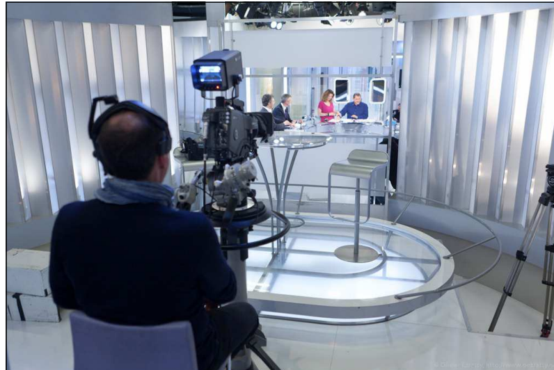
Image finale : plateau, bandeau permanent, vignette sms + même image que le générique d 'ouverture.