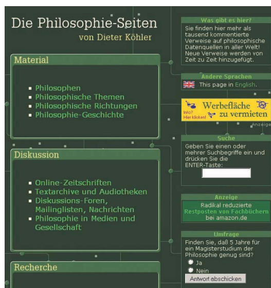
« ... les ressources en français restent cependant balbutiantes. »

Les sites offrant des œuvres en ligne sont eux aussi très fréquentés (69,4%) et sont de plus en plus nombreux et riches. On trouve d'abord des bibliothèques de textes en français comme Gallica 11 (BnF), dont malheureusement la plupart des 90 000 textes sont numérisés en mode image, malgré les 1 250 au format texte (dont les œuvres d'une vingtaine de philosophes), ABU 12 qui offre 288 textes (une vingtaine de philosophes aussi), ou les Classiques des sciences sociales 13 qui, avec près de 3 000 œuvres numérisées, offre le plus grand nombre de textes philosophiques modernes et contemporains en français mais peut poser des problèmes de droits d'auteur, la législation canadienne n'étant pas la même qu'en France. Le site académique de Nice a commencé à constituer sa propre bibliothèque, avec