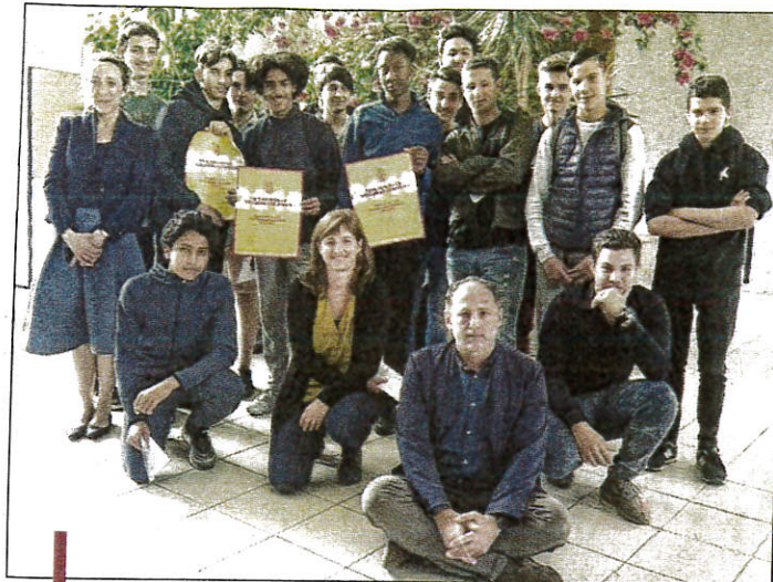
ces lycéens sont devenus les premiers Marseillais à avoir gagné le concours national de la critique cinématographique.