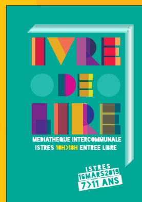
IVRE DE LIRE 16 mars 2019 Istres