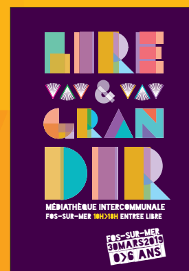
LIRE & GRANDIR 30 mars 2019 Fos-sur-Mer

Entrée libre Renseignements 04 90 58 53 53 – 04 42 11 16 85 www.mediathequeouestprovence.fr