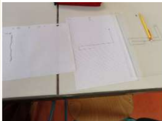
Le code, le labyrinthe et le parcours