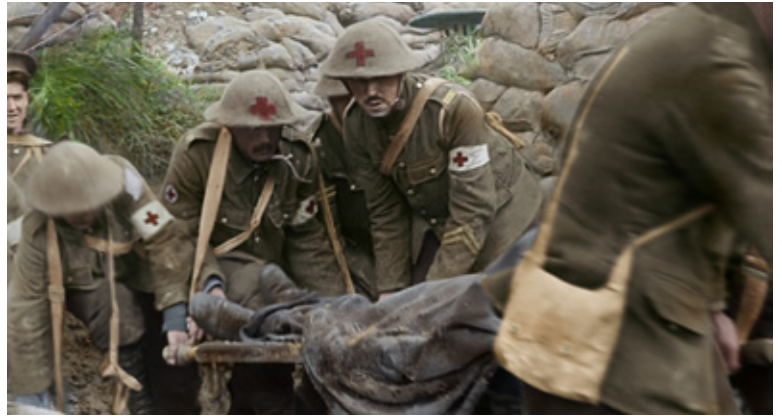
DOCUMENT B : ÉVACUATION D'UN BLESSÉ