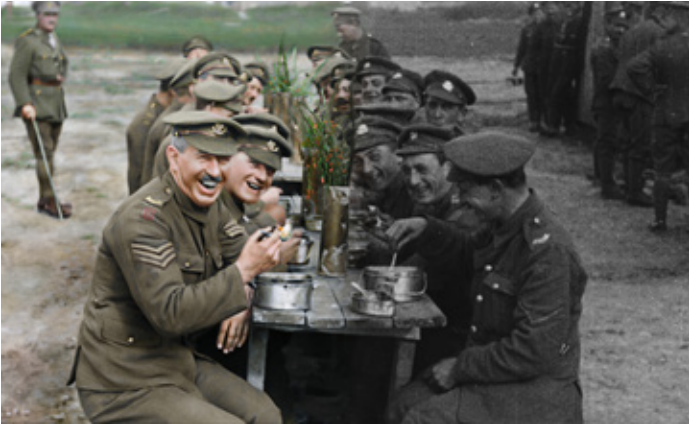
DOCUMENT D : DU NOIR ET BLANC À LA COULEUR : LES MIRACLES DU NUMÉRIQUE