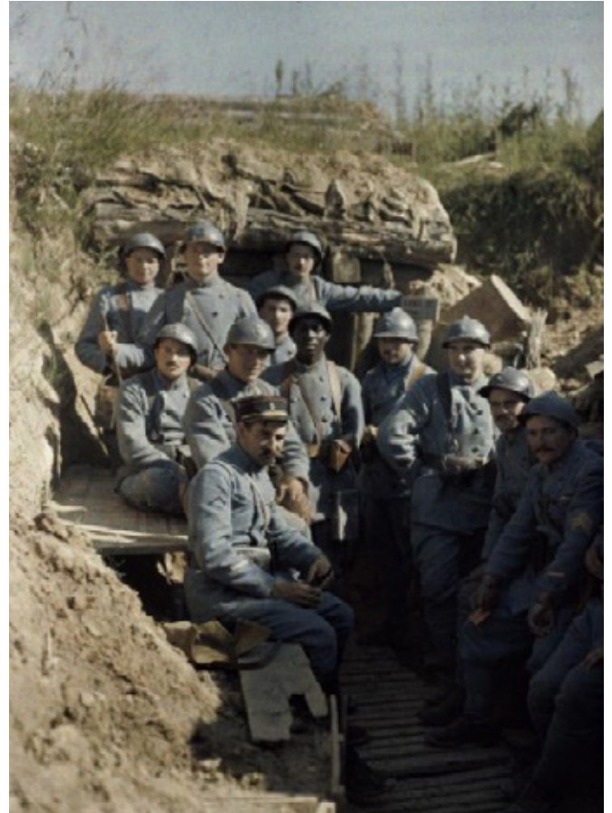
DOCUMENT E : TRANCHÉE DE PREMIÈRE LIGNE: 16 JUIN 1916 AUTOCHROME DE PAUL CASTELNAU

© Ministère de la Culture/ Médiathèque du Patrimoine Réf: 07-534201/CA000500 https://www.histoire-image.org/fr/etudes/regard-tranchees