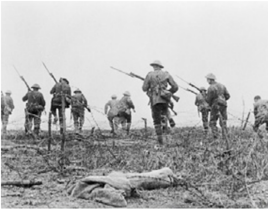
DOCUMENT A : L'ASSAUT