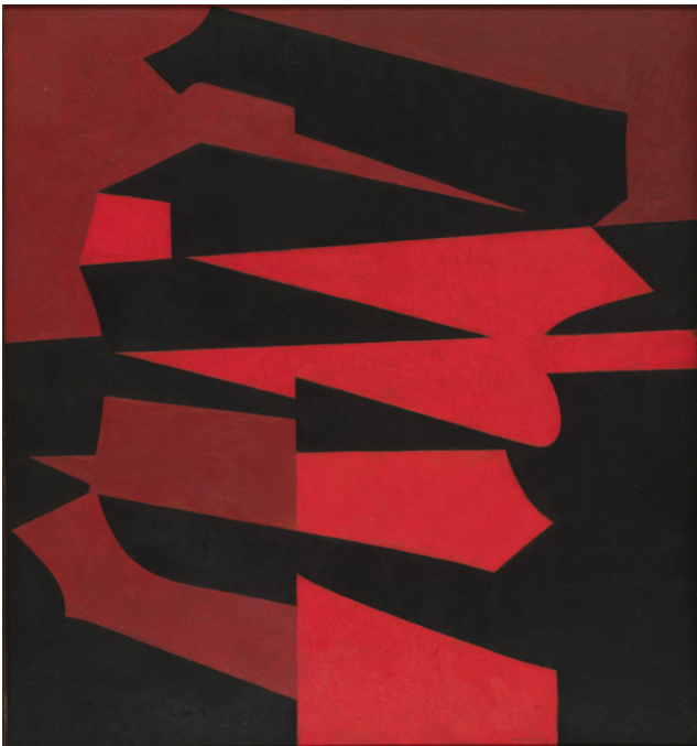
Taska , 1950 Huile sur isorel, 65 x 60 cm, Collection particulière

Vasarely prit le tournant décisif de son orientation en 1947. En dehors de ses absorbantes recherches graphiques, Vasarely ne peut demeurer indifférent à ce que font les peintres de son temps. Il découvre la peinture et réalise des toiles proches du cubisme, du surréalisme, parfois même de tendance gestuelle. Il abandonne progressivement ces "fausses routes" pour obéir à une voix plus profonde et personnelle qui l'incitait à sublimer de plus en plus l'objet identifiable pour se diriger vers l'abstraction. L'insertion dans le temps des périodes ci-dessus décrites est approximative. En fait elles se développent parallèlement ; de tels chevauchements se retrouveront tout au long de son œuvre.