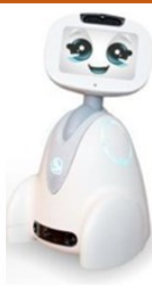
BUDDY 5 à 11 ans