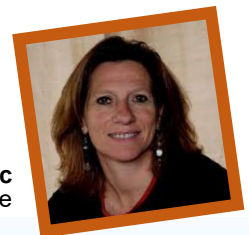
Valérie Maurin-Dulac IA-IPR établissements et vie scolaire

Alors que le nombre d'élèves en situation de handicap augmente d'environ 7% par an dans le 2 nd degré, les IA-IPR établissements et vie scolaire, sont naturellement confrontés au questionnement des établissements sur la mise en œuvre d'une scolarisation réussie pour tous les élèves. Le dossier de cette lettre d'hiver vous propose quelques éléments de réflexion non exhaustifs pour améliorer l'accessibilité des collèges et des lycées.