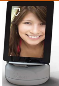
EDMO Adolescents et adultes

Dans la région académique, 54 robots ont été déployés et leur déploiement se poursuivra tout au long de l'année scolaire. 32 professeurs-ressources académiques de la Miraep ont bénéficié d'une formation au dispositif afin d'apporter des réponses de première intention aux équipes pédagogiques concernées.