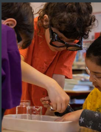
ENSEIGNER LA CHIMIE À L'ÉCOLE

A travers son programme cliquable, la Fondation propose notamment une sélection de ressources couvrant des notions scientifiques aux programmes scolaires (cycles 1, 2 et 3) du Bulletin Officiel (Bulletin officiel spécial n°11 du 26 novembre 2015). Cette sélection ne constitue pas une programmation : chaque professeur – seul ou en équipe – est libre de traiter un, plusieurs ou tous les thèmes de son année - en construisant sa propre progression annuelle au sein de son cycle.