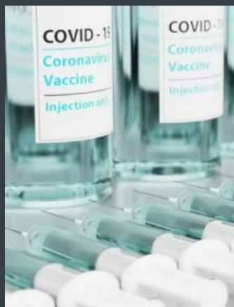
SANTÉ ET VACCINATION