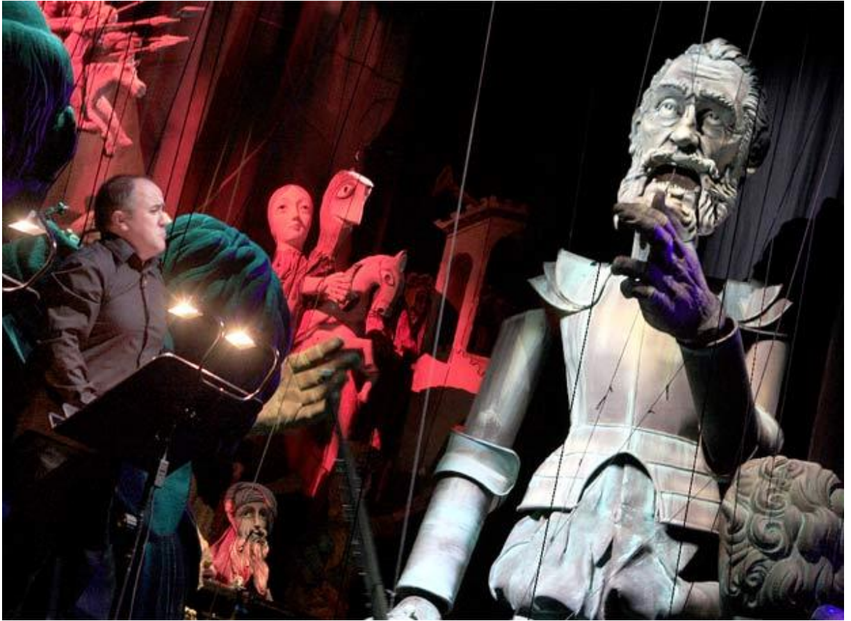
El Pais, Lunes 26 de Enero de 2009 Santi Burgos

et innocente voix, il explique aux spectateurs ce que va représenter le petit théâtre de marionnettes.