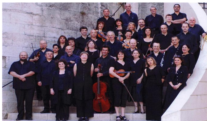
Les musiciens de L'Orchestre d'Avignon