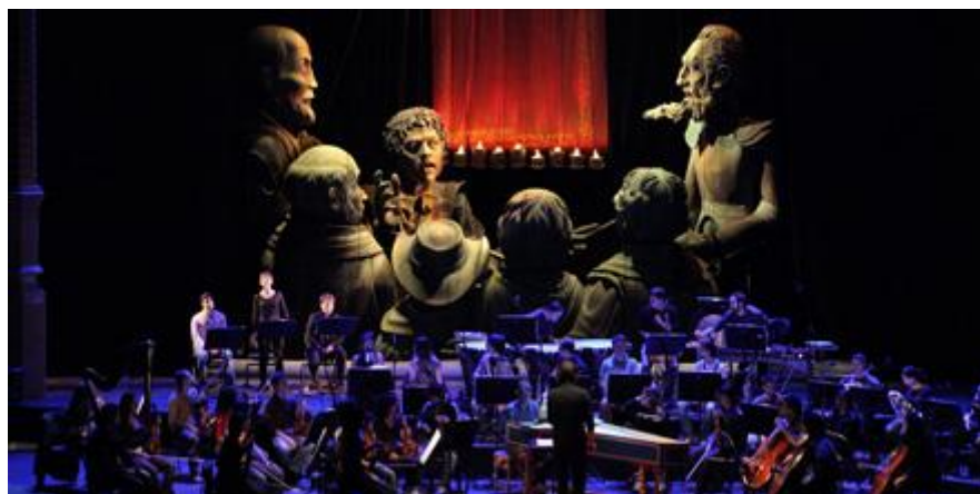
Palais des Beaux Arts 6/02/2010 - Coproduction: Bozar Music | La Monnaie | Instituto Cervantes

1 er niveau : Au premier plan, l'orchestre constitue le premier niveau, celui qui englobe tous les autres. L'orchestre et les chanteurs interprètent l'œuvre de Manuel De Falla, Les Tréteaux de Maître Pierre , sur la scène d'un théâtre.