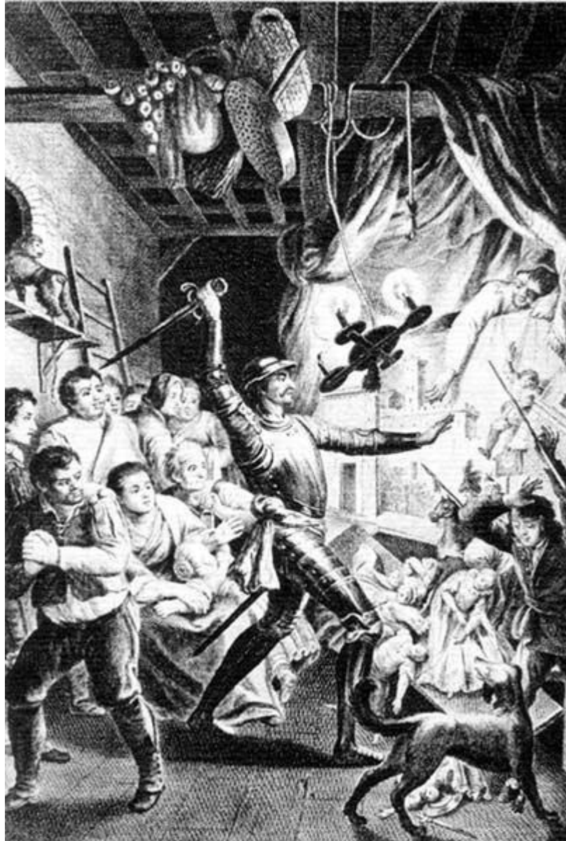
Don Quichotte met le théâtre de marionnettes en pièces