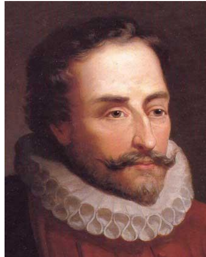
Miguel de Cerventès

2ème niveau : Dans ce cadre scénique, le metteur en scène ouvre un nouvel espace, celui de la scène dans l'auberge, avec des marionnettes grand format. Il y est question d'un spectacle imaginé par Manuel De Falla, à partir de l'œuvre du dramaturge espagnol Miguel de Cerventès, L'ingénieux hidalgo Don quichotte de la Manche , publiée en 1605.