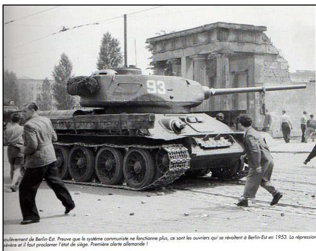
Soulevement de Berlin-Est. Preuve que le système communiste ne fonctionne plus, ce sont les ouvriers qui se révoltent à Berlin-Est en 1953. La répression s'ensuit et il faut proclamer l'état de siège. Première alerte allemande !