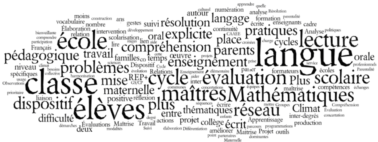
Illustration de la fréquence des mots utilisés dans les réponses des réseaux pour expliciter les thématiques travaillées (plus le mot apparaît en gros, plus il est apparu fréquemment)

Les thématiques de ces temps collectifs sont très centrées sur les apprentissages et des problématiques pédagogiques : la langue (la maîtrise du français dans les DOM) et plus spécifiquement la compréhension en lecture , l'enseignement des mathématiques , la mise en place des dispositifs plus de maîtres que de classe et scolarisation des moins de trois ans, l'enseignement explicite , les évaluations diagnostiques.