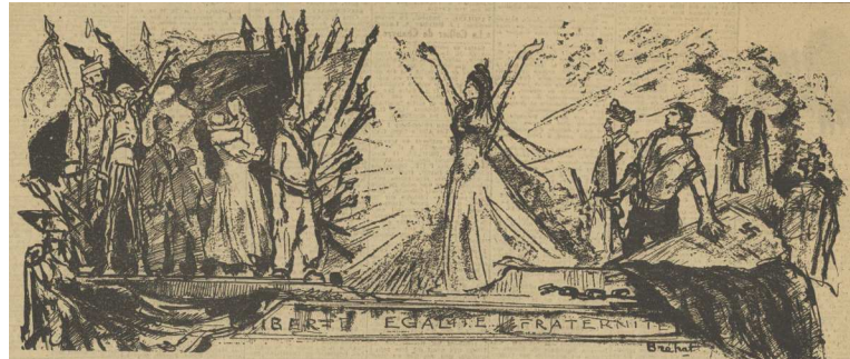
ADHA : Fol per 125, « les Allobroges (Août à juillet 1945) »