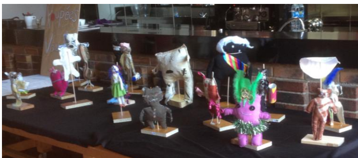
Poupées Vaudou, Collège A. Daudet,

Diverses productions au sein de la classe sont envisageables : lectures à voix haute, ateliers d'écriture, ateliers d'art plastique, montages sonores, chansons, vidéos, arts numériques etc. Il est souhaitable que ce travail soit conduit en étroite collaboration entre la classe de CM2, la classe de 6 ème correspondante et la bibliothèque ou médiathèque investie dans le projet.