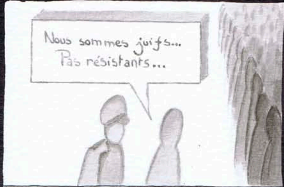
Un homme sortit du rang et s'approcha d'un SS

C'est à ce moment là... Que nous n'étions plus que du bétail Notre identité était un numéro ancré dans notre chair