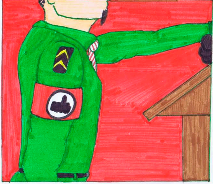
LA FRANCE EST OCCUPÉE PAR LES NAZIS... HITLER MET EN PLACE... (UN RÉGIME???)...