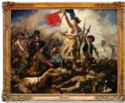
Eugène DELACROIX (Charenton-Saint-Maurice, 1798 - Paris, 1863) La Liberté guidant le peuple (28 juillet 1830). Salon de 1831 Huile sur toile H. : 2,60 m ; L. : 3,25 m Acquis au Salon de 1831 Transféré du musée du Luxembourg au Louvre, 1874 Département des Peintures

« Bon et cher frère, ta bonne lettre m'avait fait un bien grand plaisir. Pour le "spleen", il s'en va grâce au travail. J'ai entrepris un sujet moderne, une barricade, et si je n'ai pas vaincu pour la patrie, au moins peindrais-je (sic) pour elle. Cela m'a remis de belle humeur. »