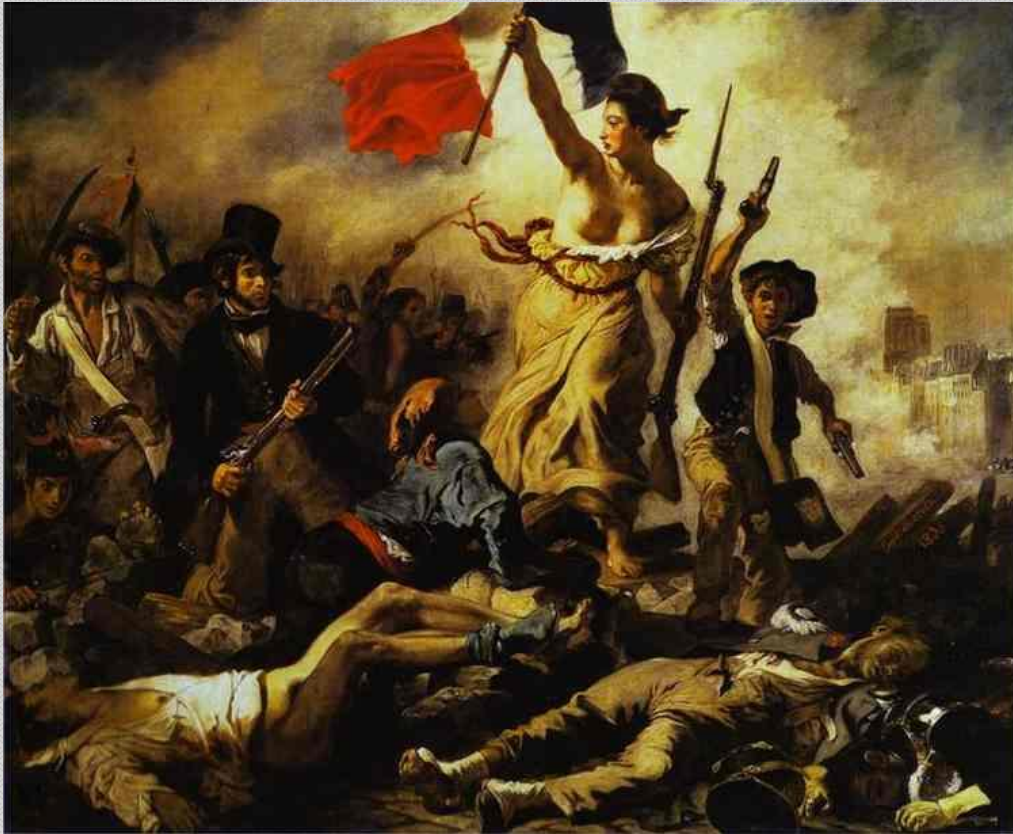
Eugène Delacroix La liberté guidant le peuple (28 juillet 1830). 1830