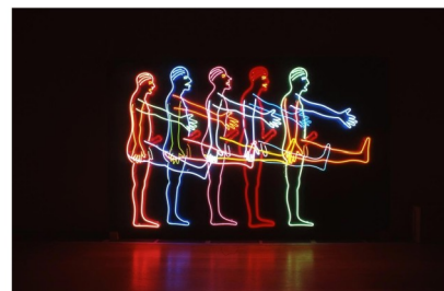
Bruce Nauman 1985 néons Five marching men