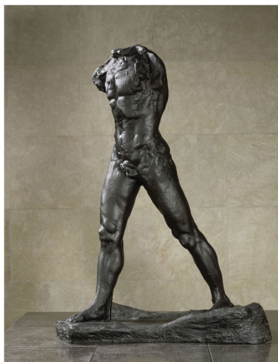
Rodin L'homme qui marche bronze de 1907