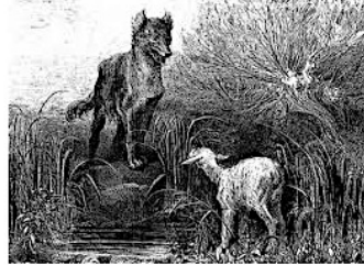
JUSTICE et DROIT Groupement de texte Autour du droit du plus fort : « le droit est-il forcément juste ? » Table des matières

PLATON : Gorgias, 483-484 Politique, 294a-298e République, II, 360e ; 368e ; IV, 431e ; 433d ; 444c Idem., V, 472c-473e ARISTOTE : Éthique à Nicomaque, V, 14, 1137b5-35 D'Aquin, T. : Somme théologique, I, II, q. 96, a. 6 (1273) Hobbes, T. : Le Léviathan, II, XVIII (1651) LAFONTAIRE, J. de : Fables, I, 10 - Le loup et l'agneau (1668) Pascal, B. : Pensées, § 298 (1669) Idem, § 291 SPINOZA, B : Traité théologico politique, XX (1670) LOCKE, J. : Second traité du gouvernement civil, II, § 134 (1690) Montesquieu, C. : L'esprit des lois, XI, 6 (1748) Rousseau, J.J : Du contrat social, I, 3 (1762) Idem, I, 8 Lettre écrite de la montagne, VIII (1764) Idem, IX Déclaration universelle des droits de l'homme, 1789 KANT, E : Critique de la raison pratique, I, 1, 3 (1788) Projet de paix perpétuelle, Appendice I/II (1795) CONSTANT, B : Principes de politique applicables à tous..., XIX (1815) THOREAU, H.D. : La Désobéissance civile (1849)