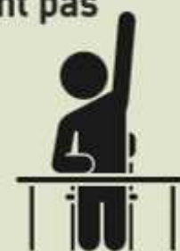
Investissement des élèves dans les 10 mn de lecture par niveau