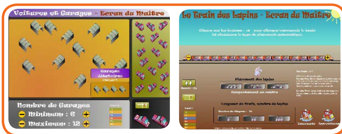
Illustrations 6 : Écrans du maître des logiciels « Voitures et garages » et « Train des lapins »

Lorsque l'on propose des ressources mathématiques pour l'école, il convient de se questionner sur ce qu'apportent ces ressources aux professeurs des écoles pour adapter leur enseignement à chacun des élèves de leur classe. Ce point est central lorsque ces ressources s'adressent à des élèves d'école maternelle car les différences entre enfants peuvent être importantes. Le nouveau programme de l'école maternelle (applicable à la rentrée 2015) souligne bien cet aspect. Pour les logiciels « Voitures et garages » et « Train des lapins », cette question de la différenciation a été prise en compte dès le processus de conception des logiciels. En effet, pour permettre aux professeurs de personnaliser le parcours des élèves sur le logiciel, des éléments du logiciel sont paramétrables par ces derniers sur l'écran du maître.