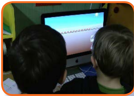
Illustration 1 : Deux élèves travaillent sur le logiciel le « Train des lapins »

Dans l'une des classes de GS (Grande Section) observée et équipée d'un seul ordinateur, le « Train des lapins » est utilisé comme exercice d'entraînement pour motiver les élèves. Des binômes d'élèves sont constitués et vont successivement travailler sur l'ordinateur de la classe. Quel dispositif a été imaginé par le professeur de cette classe ? Les élèves découvrent d'abord la situation sur le logiciel : un binôme d'élèves manipule sur l'ordinateur et les autres élèves sont des observateurs actifs (proposant des solutions en cas de blocage, commentant les actions du binôme, etc.). Plusieurs séances en atelier associant matériel tangible et travail en binôme sont menées. Le logiciel est également utilisé comme entraînement régulier pour les élèves afin de stabiliser les connaissances en cours d'acquisition sur le nombre. Alors qu'un atelier est en cours, les élèves vont par binôme s'entraîner une dizaine de minutes sur le logiciel puis réintègrent leur atelier. Le logiciel est également proposé en manipulation autonome lors de l'accueil du matin.