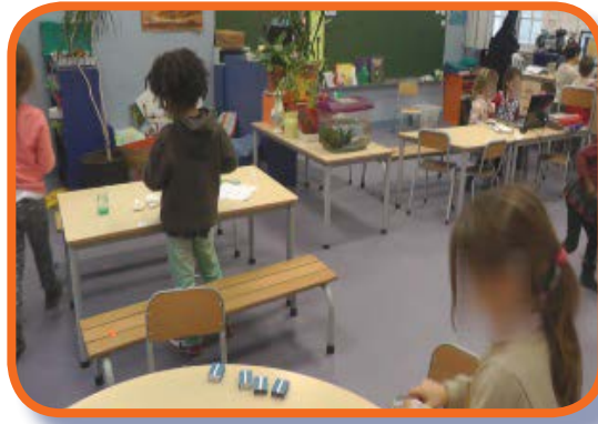
Illustration 2 : Certains élèves travaillent sur le logiciel « Voitures et garages » (fond) et d'autres avec le matériel (boîtes)