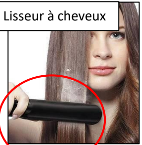
Lisseur à cheveux