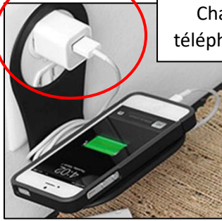
Chargeur de téléphone mobile