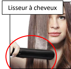
Lisseur à cheveux