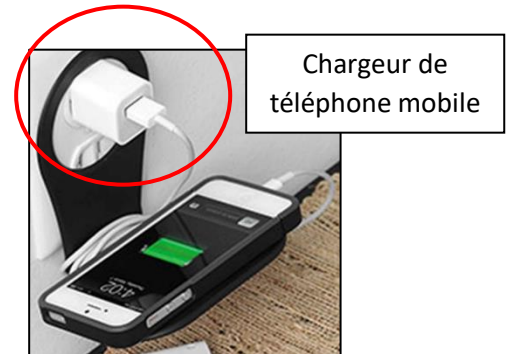
Chargeur de téléphone mobile