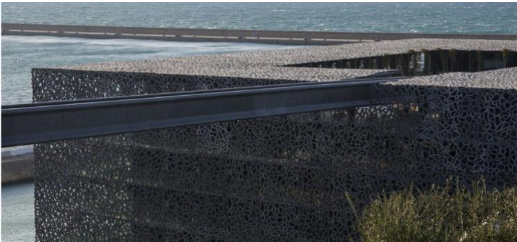
Mucem J4