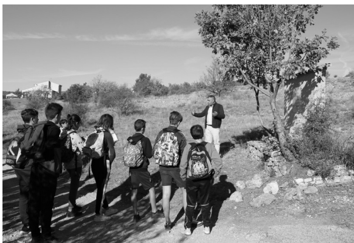
Visite de l'ancien hameau de Forestage, Ongles.

Tout au long de la journée, les élèves ont eu l'occasion de réaliser des travaux d'écriture individuels afin de commencer à constituer de la matière, traces des premières idées, des premières émotions, et réutilisables par la suite.