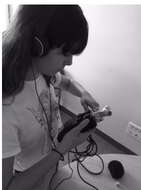
Séance d'enregistrement, Forcalquier.

C'est pourquoi les enregistrements sonores, montés par Bat Sheva Papillon, sont accessibles en ligne ( https://soundcloud.com/arriverdemain , site du collège, de la MheMO et de l'ONAC). L'intention des enseignantes est également que les créations perdurent, et les enregistrements sonores seront restitués lors d'un Festival de documentaires à l'automne ( https://www.lamiroiterie.org/ ), au cinéma de Forcalquier, en écoute publique. Ils seront également diffusés par Fréquence Mistral, radio locale.