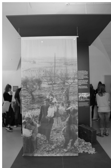
Visite des élèves de la Maison d'Histoire et de Mémoire, Ongles.

Des rencontres avec des témoins de l'Histoire, des lieux de mémoire, mais aussi un auteur et une éditrice