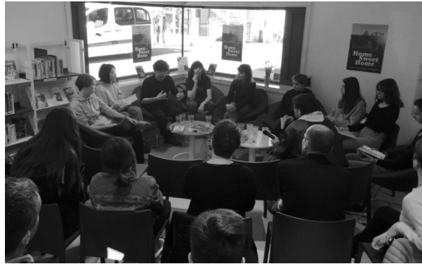
Rencontre publique animée par les élèves autour du roman Home Sweet Home à la Médiathèque, Forcalquier

Au mois de juin 2020, une documentariste sonore, Bat Sheva Papillon, est intervenue lors d'une journée pour former les élèves à la prise de son et leur permettre d'enregistrer, seul ou à plusieurs, leurs textes. Autre rencontre et nouvelles pratiques, ce temps a été l'occasion pour les élèves non seulement de découvrir un métier, documentariste sonore, mais aussi d'aborder les aspects techniques d'une prise de sons, d'être responsables d'un enregistrement, autant que de retravailler l'écriture de leurs textes dans le but d'une oralisation, et de s'entraîner à la lecture à voix haute, seul ou à plusieurs, à destination un auditeur inconnu.