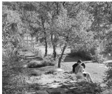
Séance d'écriture, Ongles.

Au mois de juin 2020, une documentariste sonore, Bat Sheva Papillon, est intervenue lors d'une journée pour former les élèves à la prise de son et leur permettre d'enregistrer, seul ou à plusieurs, leurs textes. Autre rencontre et nouvelles pratiques, ce temps a été l'occasion pour les élèves non seulement de découvrir un métier, documentariste sonore, mais aussi d'aborder les aspects techniques d'une prise de sons, d'être responsables d'un enregistrement, autant que de retravailler l'écriture de leurs textes dans le but d'une oralisation, et de s'entraîner à la lecture à voix haute, seul ou à plusieurs, à destination un auditeur inconnu.