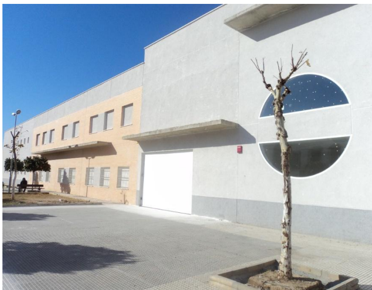
FONDATION TAS à BRENES (SEVILLE)