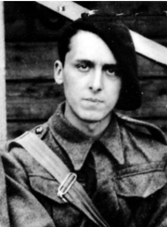
1940 à Londres

« Nous n'étions pas des résistants, nous étions des soldats »