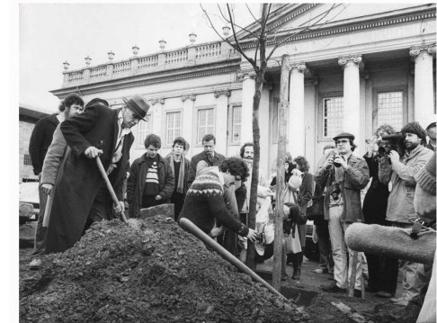
Joseph Beuys 7000 chênes 1982, action réalisée à Kassel

P. Picasso Guernica 1937 artiste et œuvre engagée