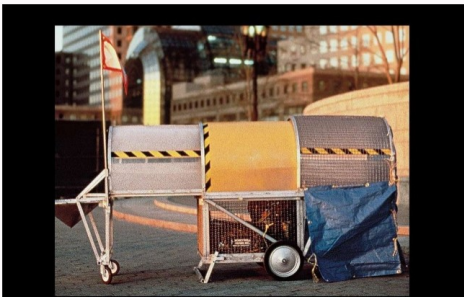
Krzysztof Wodiczko. Homeless Vehicle in New York City. 1988-1989.

Joseph Beuys 7000 chênes 1982 action artistique et écologique