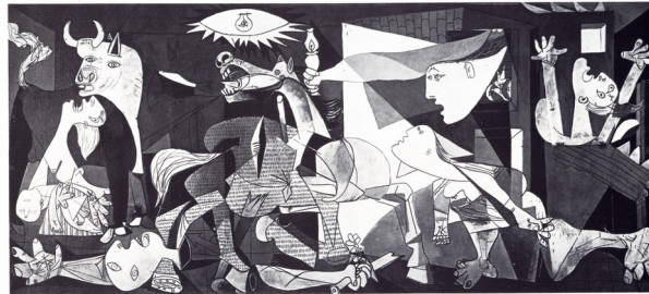
Pablo Picasso GUERNICA mai 1937 huile sur toile, 351 x 782 cm, Centre d'Art de la Reine Sofia, Madrid

F. Goya El tres de mayo 1814 dénoncer par la peinture