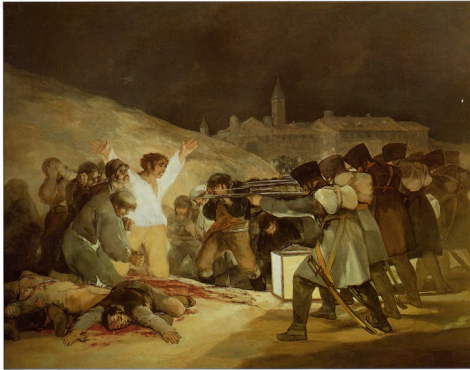
El tres de mayo 1808, Francisco Goya, 1814, huile sur toile, 266 x 345 cm, musée du Prado, Madrid.

Les artistes ne restent pas dans leur « tour d'ivoire » et s'occupent ou se préoccupent aussi de la vie de la cité. Ces diverses formes artistiques d'engagement peuvent s'inscrire à l'échelle géographique mondiale ou dans une dimension historique.