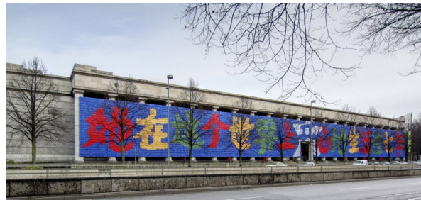
AI WEIWEI REMEMBERING, 2009 HAUS DER KUNST

K. Wodiczko Homeless véhicule 1988-1989 sculpture et engagement social