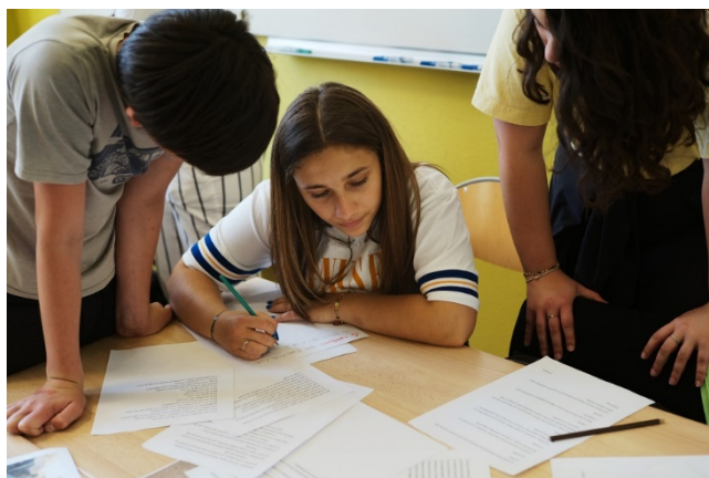
© Vincent Beaume • Festival d'Aix 2018