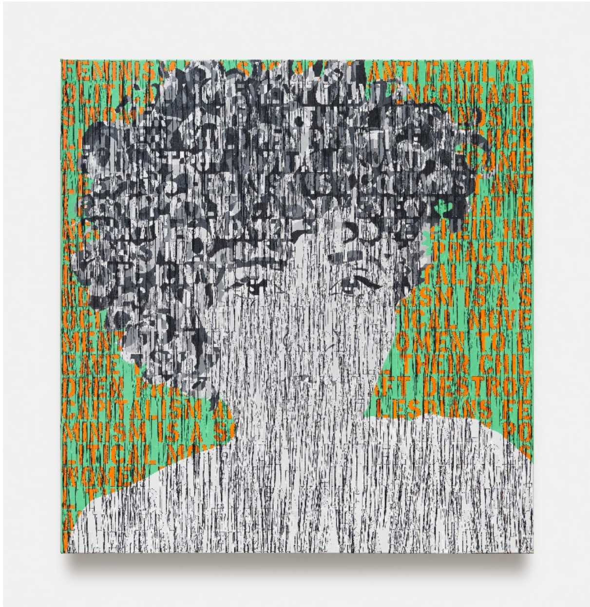
Ghada Amer, Self-Portrait in Black and White [Autoportrait en noir et blanc], 2020 Peinture acrylique, broderie et gel médium sur toile, 127 X 121.92 cm © Ghada Amer

Par de passionnants transferts d'une technique à l'autre, les expérimentations picturales de Ghada Amer investissent le champ de la sculpture – à travers installations et sculptures paysagères, mais aussi à travers des œuvres en céramique et en bronze récemment poussées dans le sens de la monumentalité. Du 1/12/2022 au 16/4/2023