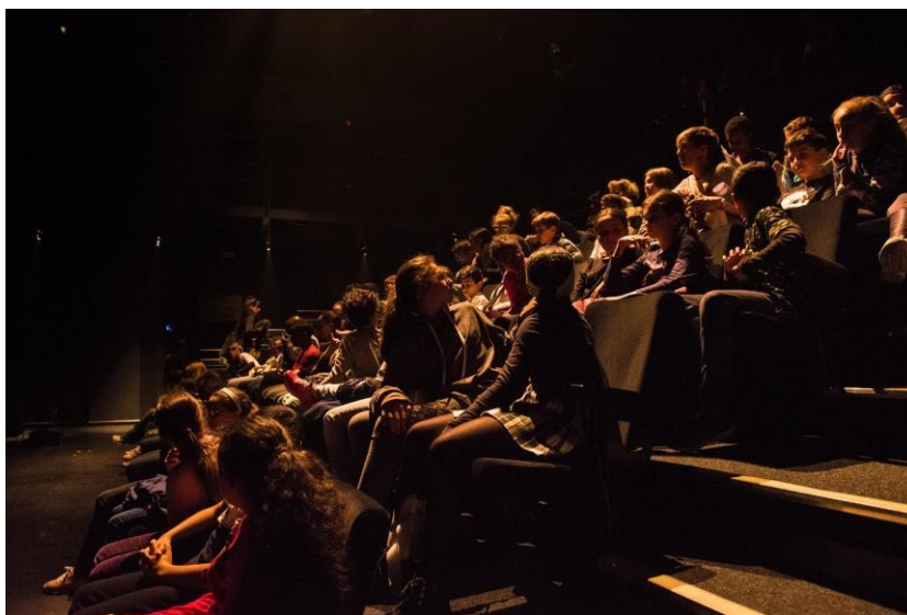
Séance scolaire Festival Les Musiques 2019