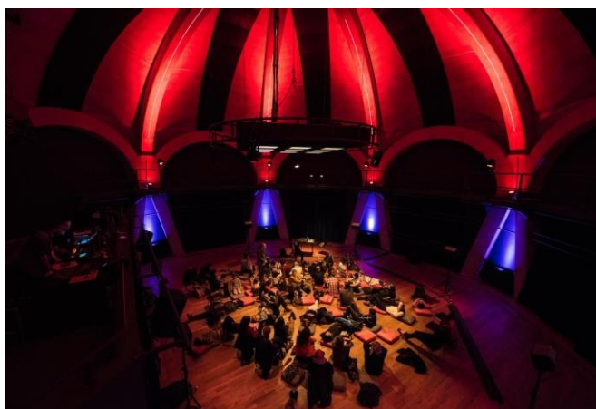
Ateliers de découverte des musiques électroacoustiques / Novembre 2019 Écoutes commentées / février 2020