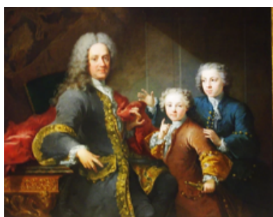
Robert Tournière « Portrait supposé de M. Saint Cannat et de ses enfants »