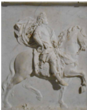
Pierre Puget « Portrait Louis XIV »