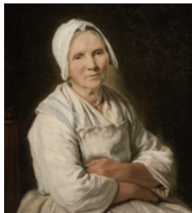
Françoise Duparc « Vieille Dame »