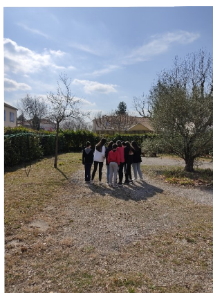
Les élèves élaborent des plans d'aménagement... (mois de janvier)