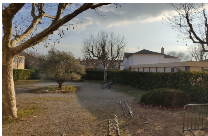
Un coin sans fleurs ni couleurs...