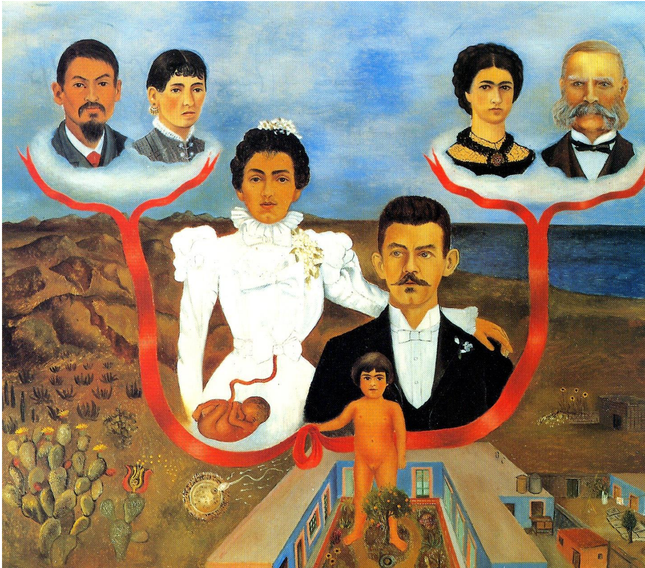
Frida Kahlo, Mes grands-parents, mes parents et moi ( Mis abuelos, mis padres y yo , 1936, huile sur toile, 319 sur 299, Museum of Modern Art, New York)