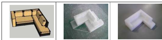
Modèle sketchup 3D